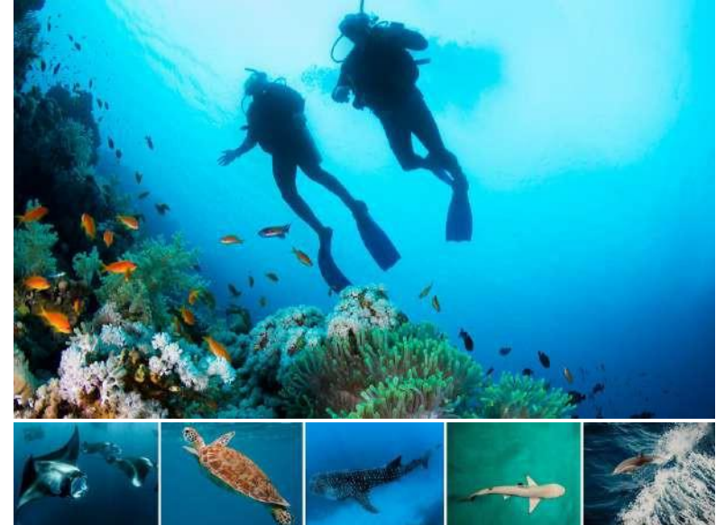
5 BIG FIVE DO MAR

Descubra o fabuloso mundo subaquático ou explore as águas cristalinas ao redor da nossa ilha, com uma variedade de excursões e esportes aquáticos emocionantes para todas as idades e habilidades.