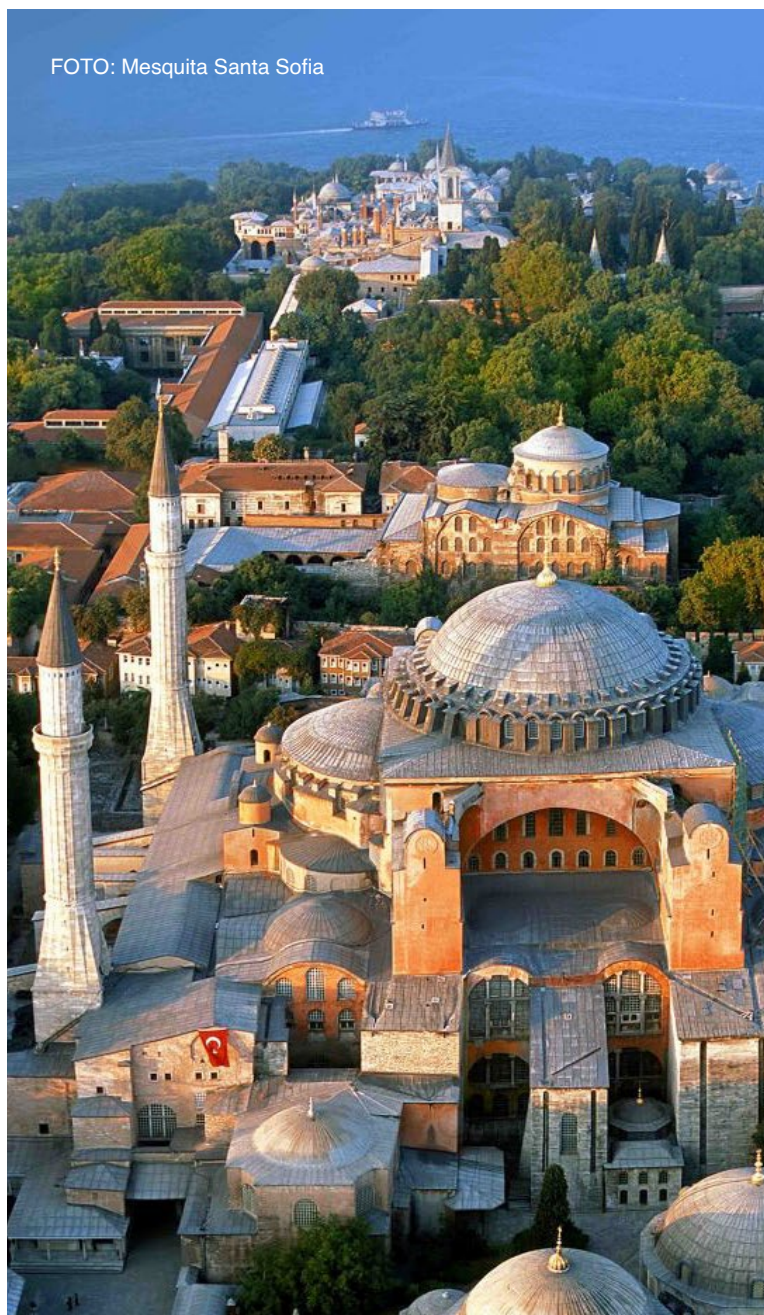
FOTO: Mesquita Santa Sofia