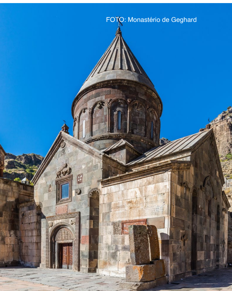
FOTO: Monastério de Geghard