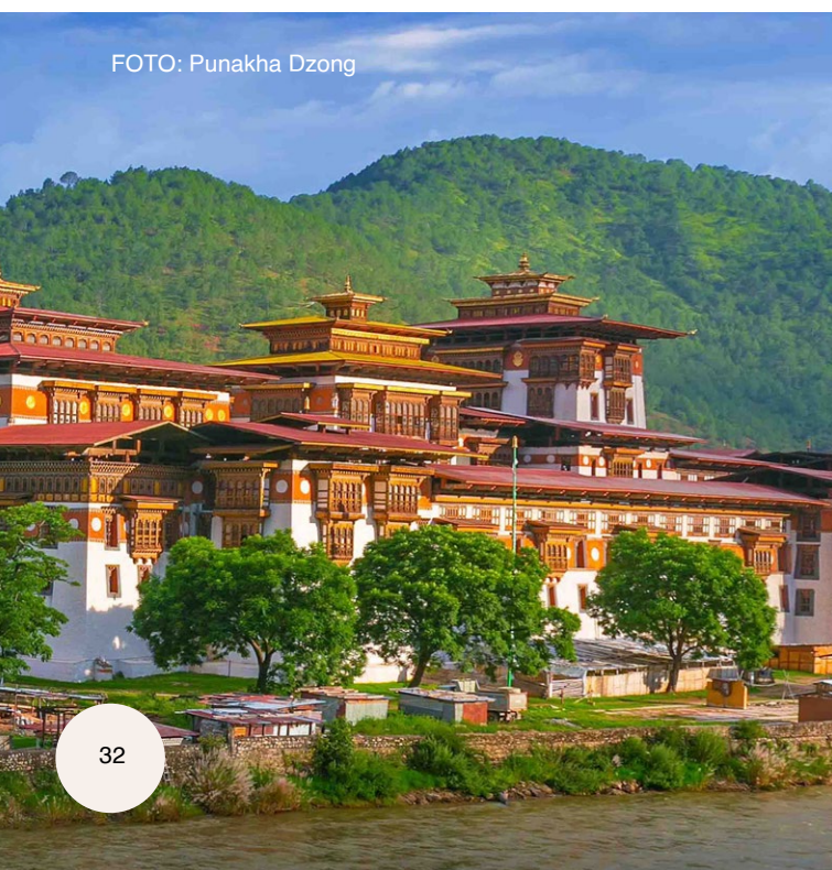
FOTO: Punakha Dzong

Após um leve café da manhã, subida ao Mosteiro Ninho do Tigre (Taktsang) – na altitude de 3000 metros, sendo esse o cartão-postal do Butão e um dos lugares de peregrinação budista mais relevantes do mundo. A lenda conta que no séc. VIII, o Guru Rimpoche, quem trouxe o budismo ao Butão, teria aí pousado, sendo trazido no lombo de um tigre