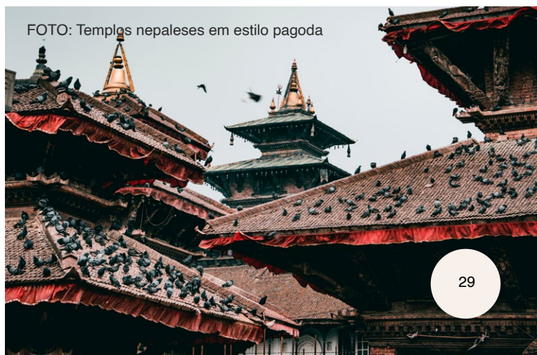
FOTO: Templos nepaleses em estilo pagoda