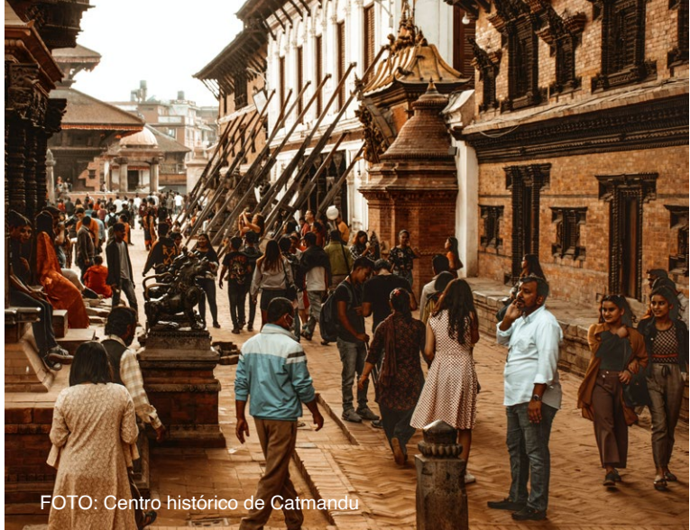
FOTO: Centro histórico de Catmandu