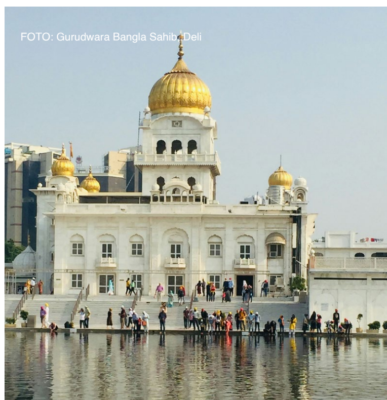
FOTO: Gurudwara Bangla Sahib, Deli

Café da manhã no hotel e saída para passeio pela parte nova e antiga de Deli . Na parte antiga, parada do lado de fora da maior mesquita da Índia: Jama Masjid (1656) ou Mesquita-I-Jahanuma – “a que comanda o mundo” – acomoda mais de 25 mil devotos em seu pátio interior. Passa-se em frente também ao Forte Vermelho – e, depois, passeio de riquixá em Chandi Chowk – para se ver típicos comércios. Visita ao interior do Raj Ghat – memorial em homenagem ao Gandhi. Continuação até o Gurudwara Bangla Sahib – aberto 24h por dia, 7 dias de semana, um templo da religião Sikh – muito