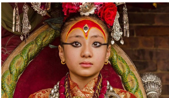
FOTO: Kumari de Catmandu

a alma da Deusa hindu taleju. Ela é escolhida dentre diversas candidatas da etnia shakya a mesma do Buda, após passar por uma série de testes e rituais. Se tiver sorte, ela sairá na janela por alguns segundos. Na sequência, passeio de riquixá da praça Durbar até Thamel – lugar ótimo para compras.