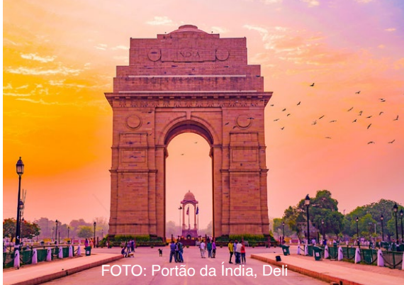
FOTO: Portão da Índia, Deli