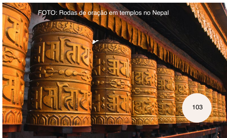
FOTO: Rodas de oração em templos no Nepal

Após o café da manhã bem cedo, saída do hotel rumo a estupa de Swayambhunath (UNESCO) e a Praça Durbar de Catmandu (UNESCO). A estupa de Swayambhunath , reina empoleirada no topo de uma colina, em uma cúpula branca, com um pináculo dourado, que se avista desde muito longe. Também conhecida como o Templo dos Macacos , pois se vê muitos ao seu redor. De acordo com os registros históricos, a estupa tem mais de 2500 anos. O nome de Swoyambhunath deriva da palavra sânscrita, Swayam (eu), tornando Swoyambhunath o “Auto-Criado”, pois sua origem é mística e incerta. Há templos, santuários e os olhos de Buda no pináculo – seu nariz é o número “1” na escrita Devanagari. Encante-se com a vista panorâmica do vale. Na sequência, ida a Praça Durbar de Catmandu – um complexo de 3 praças principais com palácios, templos e comércio. Daqui, passeio pela Freak Street famosa durante a era hippie. Depois, ida até o templo da Deusa Kumari de Catmandu. Essa “menina-deusa” reside no palácio com sacerdotes – acredita-se ser uma criança que reencarna